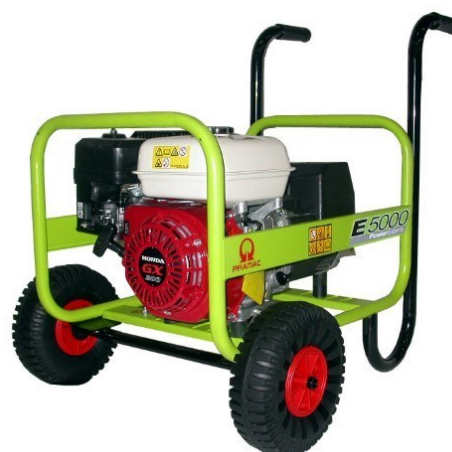
Varenr. 1480090 Kørestel med faste