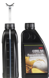
Varenr. 1480200 Generator Olie