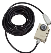
Varenr. 1809620 Rum Termostat