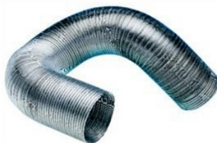
Varenr. 1809100 Alu Flexrør Ø150